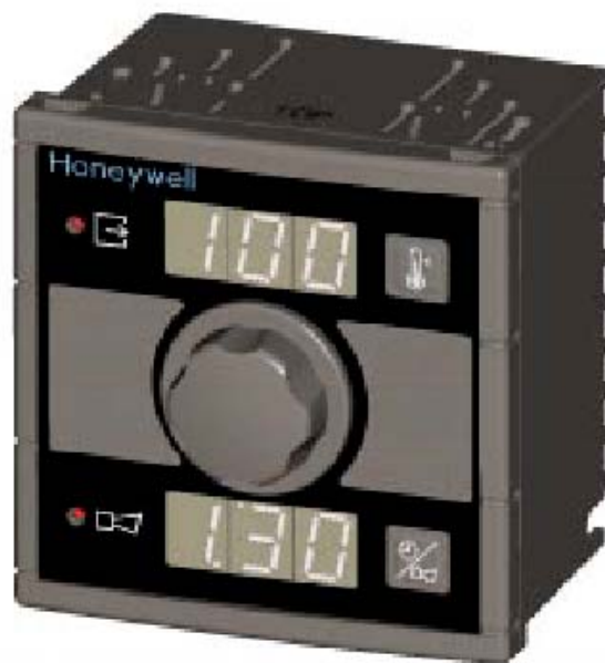
Рис. 1—Универсальный цифровой контроллер UDC100.

Согласно номера модели экран имеет 3 или 4 цифры. Стандартная модель контроллера UDC100 имеет один дисплей. Модели UDC110 и UDC120